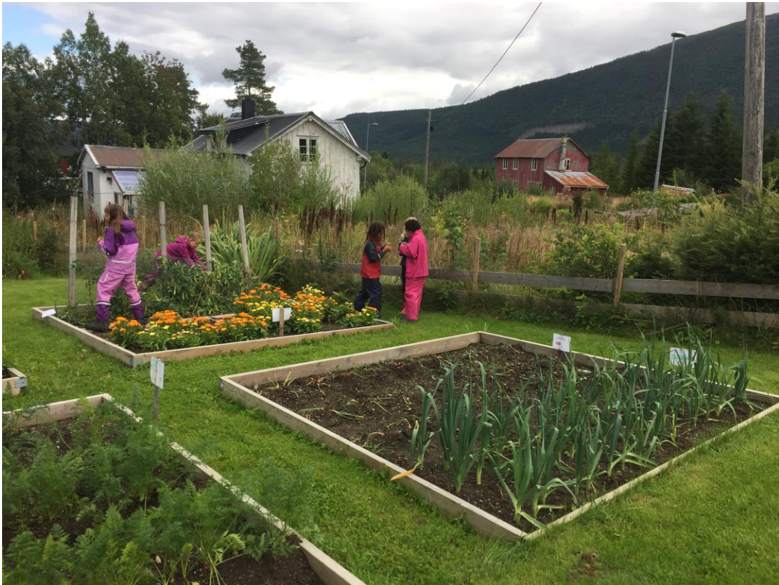
Arbeid i skolehagen høsten 2018