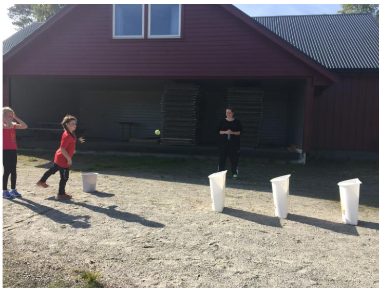
Fra idrettsdagen for 1-4 kl på MOS

Alle klassene har kroppsøving/svømming på timeplanen.